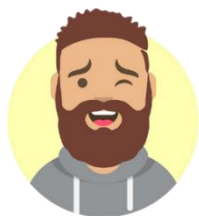
Willy • Tempo libero

L'app è organizzata in categorie raffigurate da "7 amici esperti" che hanno dritte da condividere. Di seguito gli ambiti di interesse associati ai singoli personaggi.