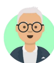
Bob • Lavoro