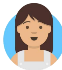
Monica • Figli

Gli utenti possono decidere quale dei 7 amici seguire accendendo o spegnendo la relativa icona. All'interno dell'app i cittadini sono in grado di visualizzare le opportunità statali e regionali, ma anche quelle specifiche del proprio Comune di residenza .